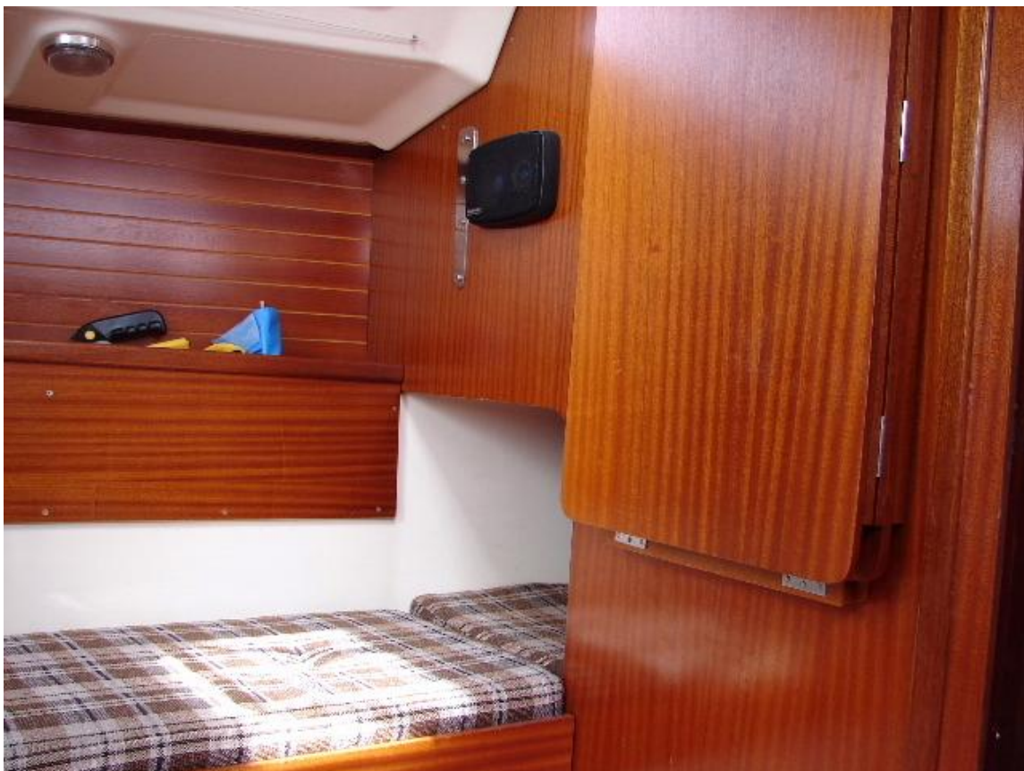
Salon an Backbord mit Klapptisch an der Wand