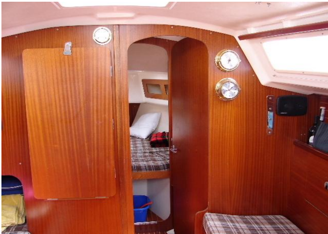
Salon mit Blick ins Vorschiff