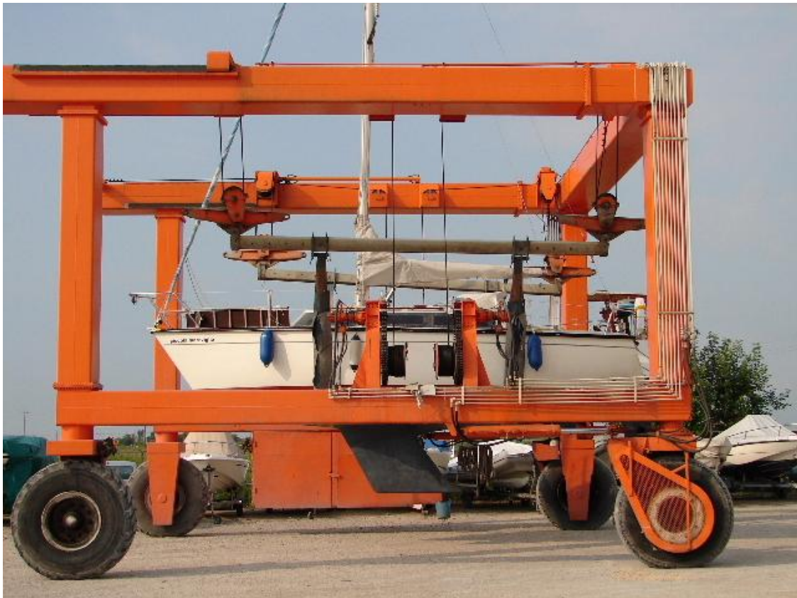
piccola meraviglia am Weg ins Wasser