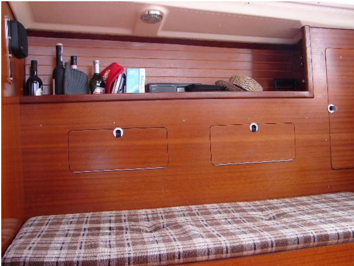
jede Menge Stauraum