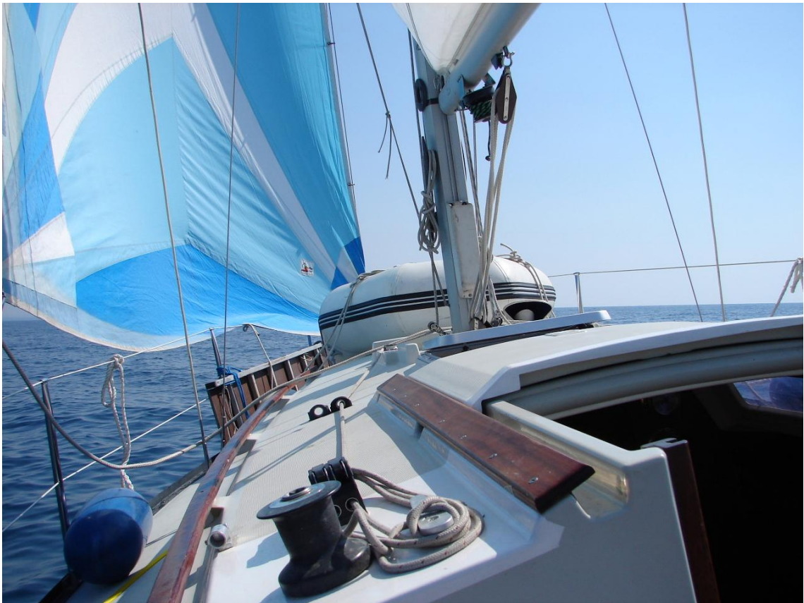
Unterwegs unter Segel