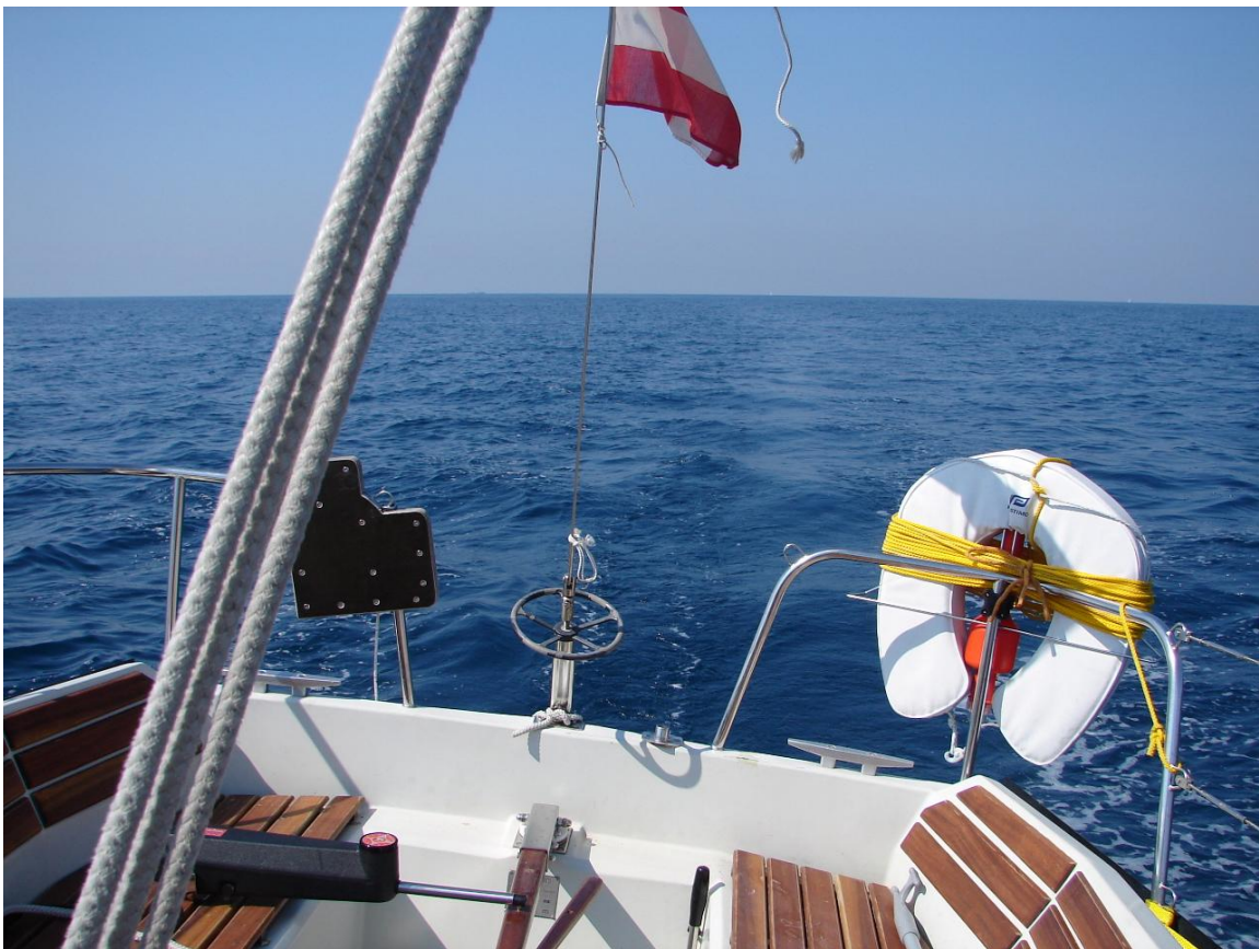
Unterwegs mit Autopilot