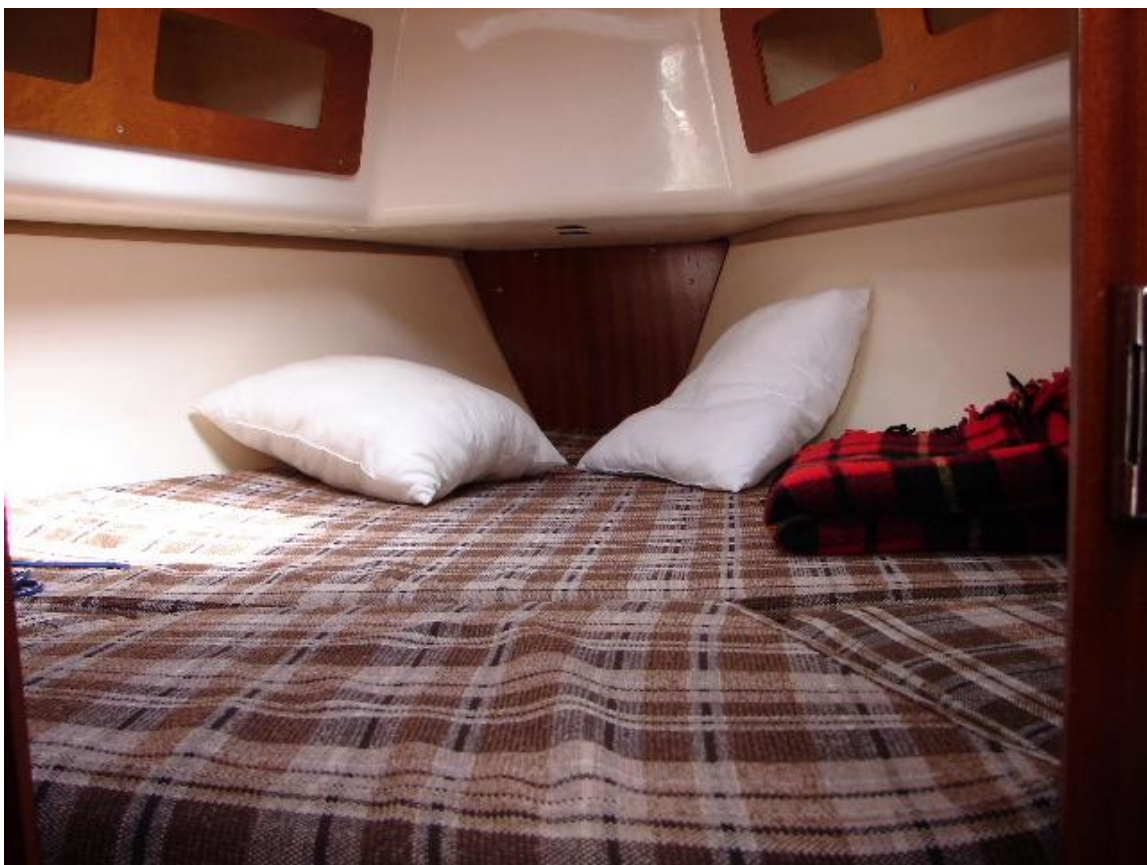
Das geräumige Vorschiff