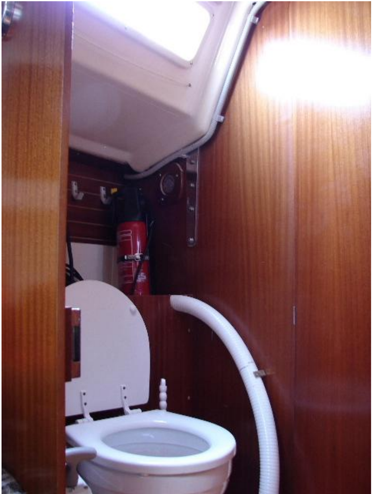
Nasszelle mit Pump-WC