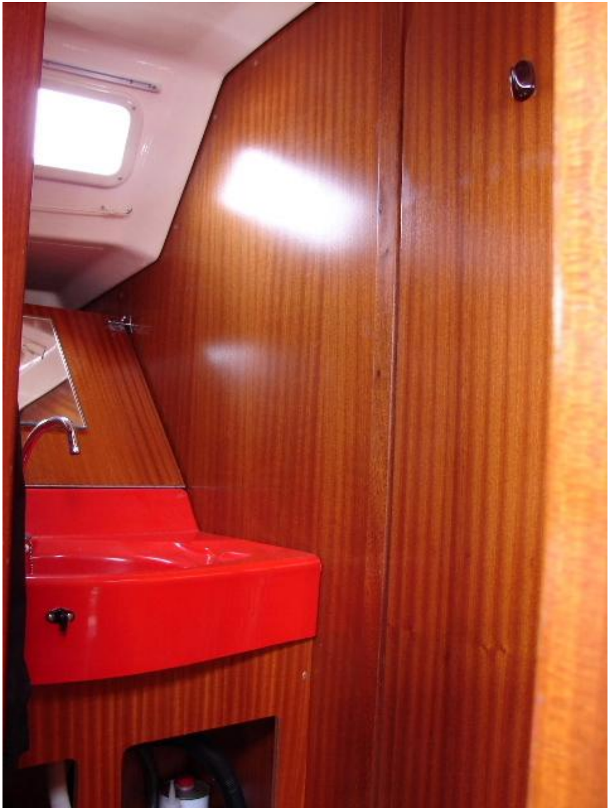
Nasszelle mit Waschbecken