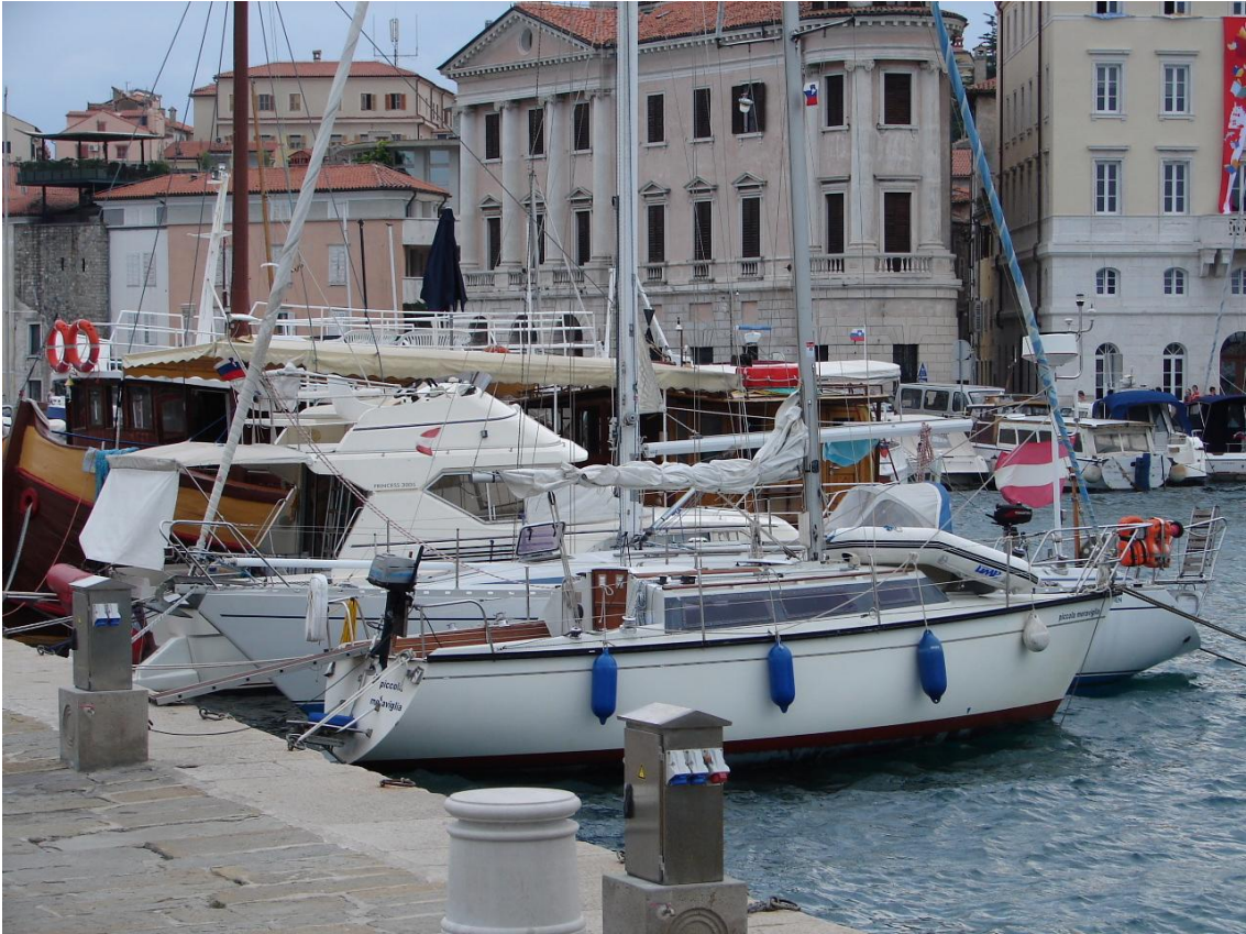
Im Hafen von Piran