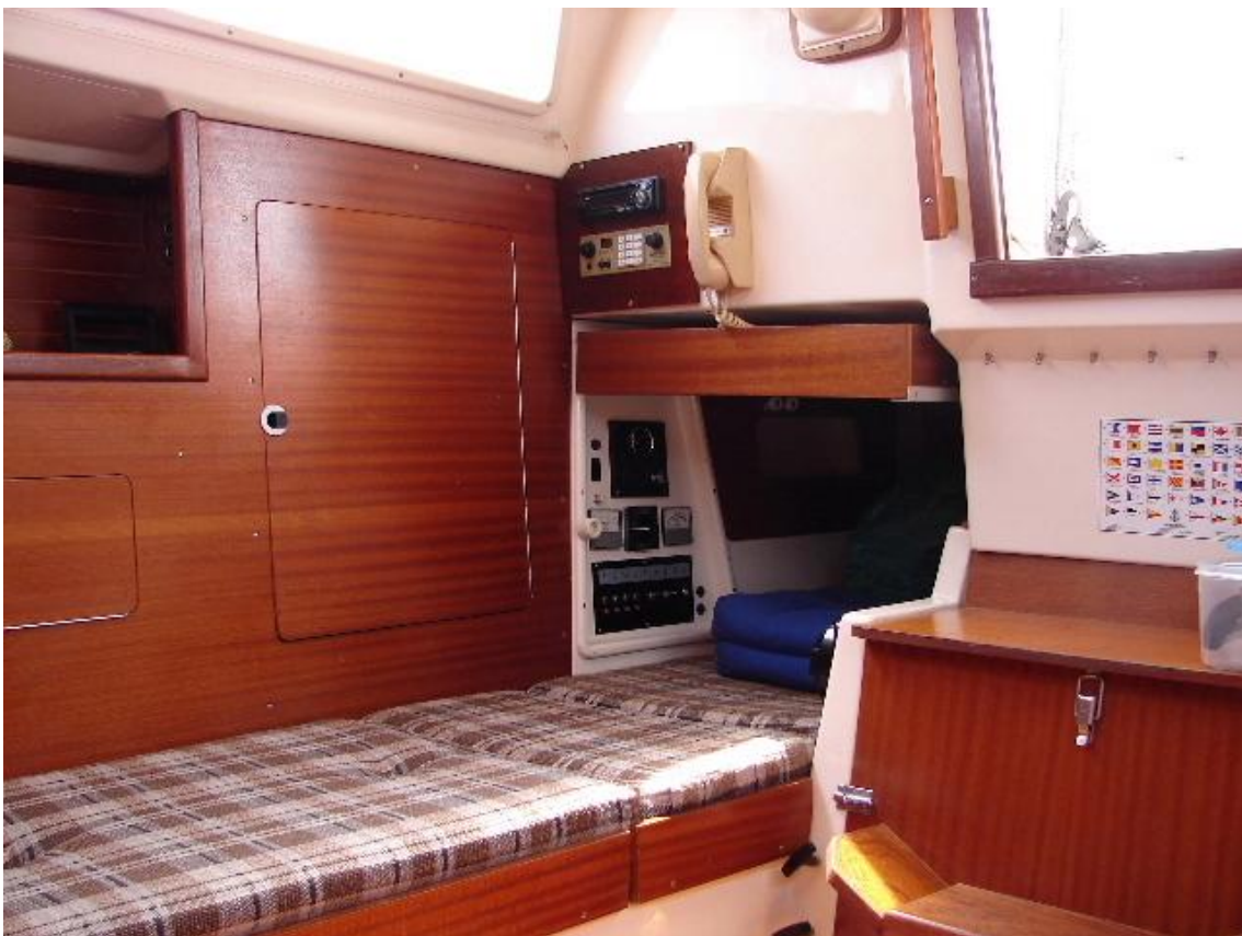
Hundekoje an Stb mit Navigationsecke und Schaltpaneel