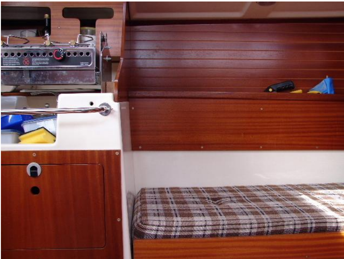
Salokoje an Backbord